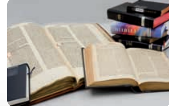
Die Bibel – ein Buch für die Welt Lutherbibel, Dietscher Bibel, Übersetzungen in 900 Sprachen