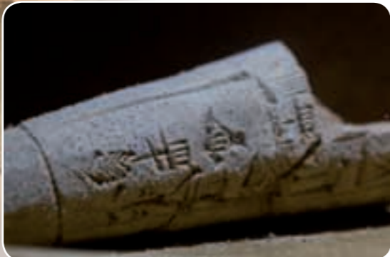
Die ältesten Schriften im Nahen Osten Keilschrift, Hieroglyphen, Alphabete, Schreibmaterialien