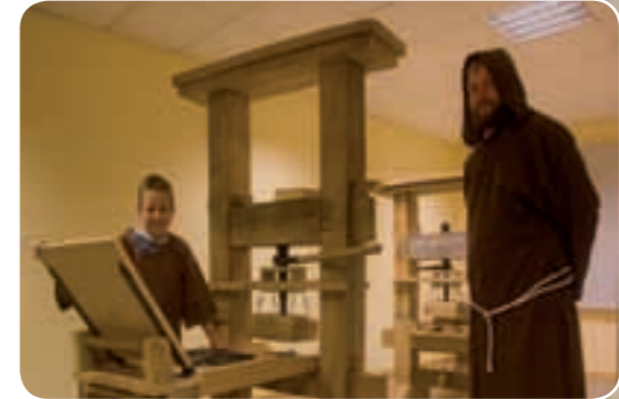
Die Bibel – das erste gedruckte Buch Gutenbergpresse, Gutenbergbibel, Inkunabeln Mitmachangebot: Buchdruck wie Gutenberg