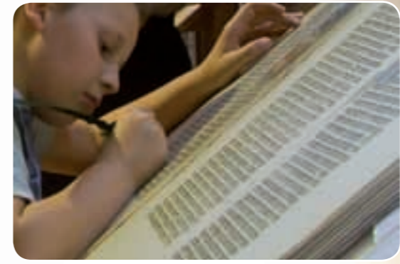
Wertvolle Handschriften Lateinische Bibel (Vulgata), Prachthandschriften, Armenbibeln, Blockbücher