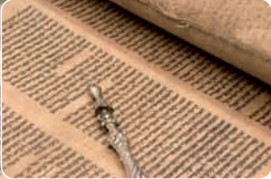
Meilensteine der Überlieferung des Alten Testaments Bibelfunde aus Qumran, hebräische Schriftrollen